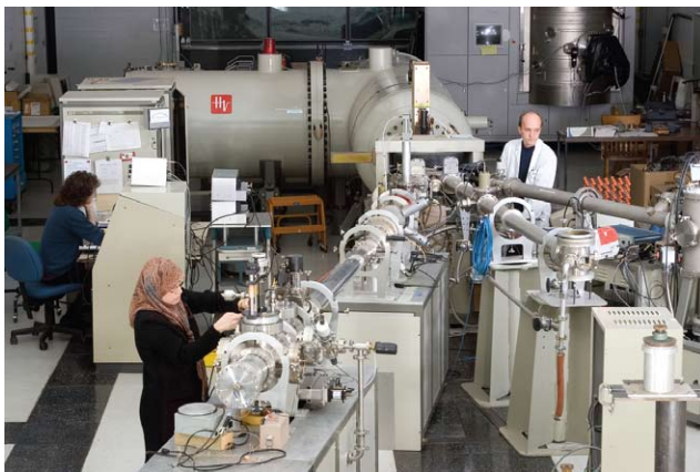
Photo du RBS du GCM. Cette technique est utilisée au GCM depuis une trentaine d'années.

On comprendra facilement que le RBS s'avère très utile pour faire des profils sur des profondeurs allant jusqu'à 2 \mu\text{m} . De plus, le RBS peut quantifier les éléments présents sans recours à des standards, ce qui constitue un avantage appréciable par rapport à d'autres méthodes comme la spectroscopie des ions secondaires (SIMS). Le seuil de détection du RBS varie entre 0.001% et 10%, dépendant de l'élément analysé et de la composition de la couche mince. Le RBS s'est taillé une place de choix dans le cœur des scientifiques oeuvrant dans le domaine du semiconducteur pour l'analyse de silicium, de l'InGaAs, de l'InP, etc.