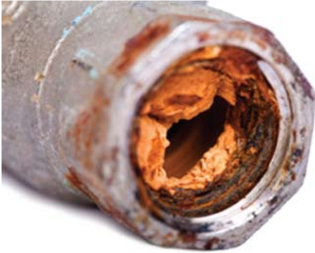
Figure 2 : Tuyau d'eau en acier galvanisé partiellement bouché par des produits de corrosion.